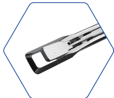
篮钳（方头） Blue Pliers (square head)