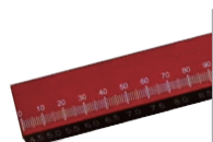
肌腱测量尺 Tendon measuring ruler