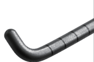
探 针 Probe