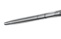
十字螺丝刀 Phillips Screwdriver