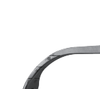
钻头限制器 Bit limiter