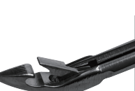
鸟嘴钳 Beak Pliers