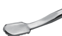
骨锉 Bone file