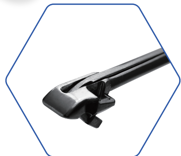
篮钳（反切） Blue Pliers (reverse cut)