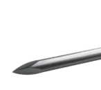
导引针 Guide Pin