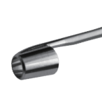
取腱器 Tendon remover