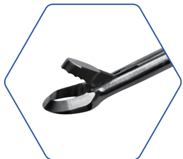
篮钳（圆头） Blue Pliers (round head)