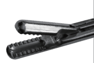
抓 钳 Grasping forceps