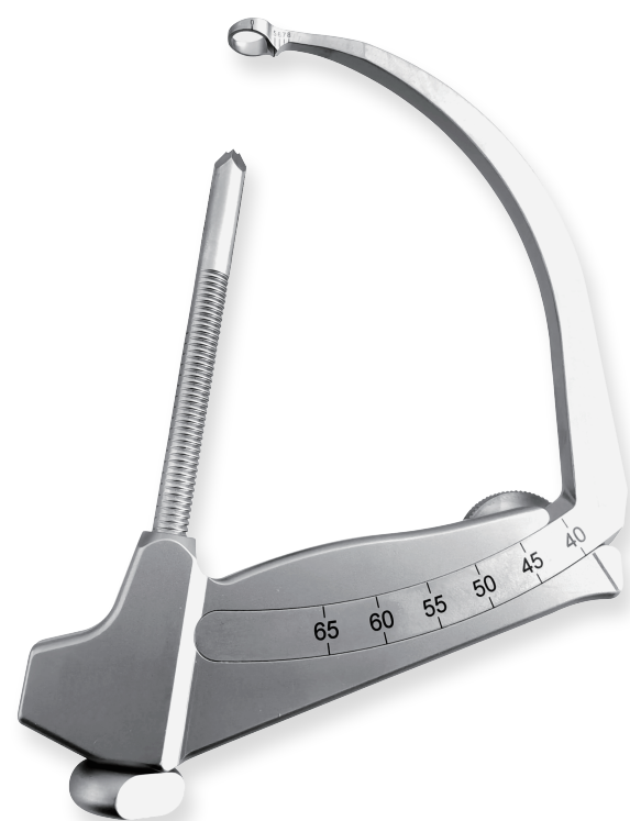
瞄准器主体 Director Drill Guide