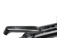
抓线钳 Wire clamps