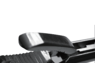
游离体抓钳 Free Body clamps