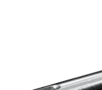
剪线器 Wire cutter