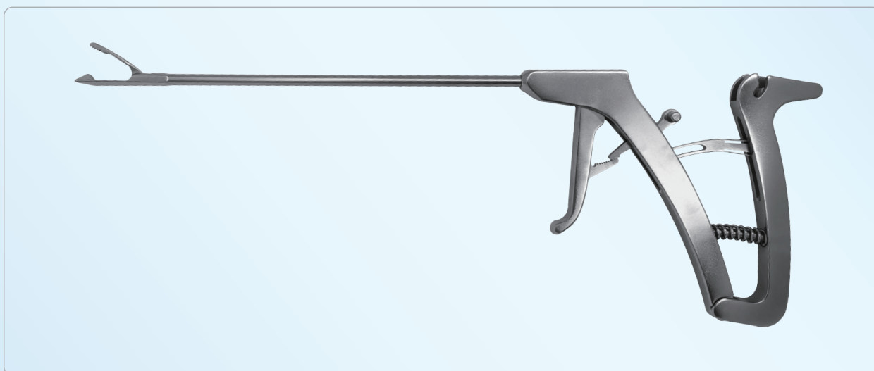
CL 肩关节缝合枪 CL SHOULDER SUTURE GUN